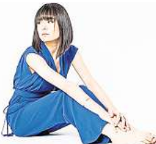
Live im HCC: Alice Sara Ott.

Eintrittskarten (20 bis 100 Euro) sind online erhältlich über promiscia-hannover.de .