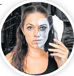
Das Theater Violentia zeigt das Stück „Die Familie des Vampirs“.

saugende Gestalt? Der Eintritt kostet 9,50 Euro, mit Aktivpass und für alle unter 18 Jahren 4,75 Euro. Karten gibt es per E-Mail an stadtteilkultur-vahrenwald@hannover-stadt.de .