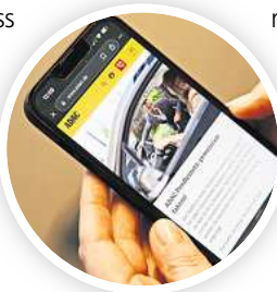
Per App zur Fahrgemeinschaft.

Dabei unterscheidet die Untersuchung nicht, ob die Pendlerinnen und Pendler den Bus und die Bahn für den Weg zur Arbeit nutzen oder das eigene Auto. Ein Blick auf Zufahrtstraßen wie die Vahrenwalder Straße am Morgen zeigt, dass nach wie vor viele Beschäftigte allein im Auto unterwegs sind. Seit sechs Monaten versucht der ADAC diese Situation nachhaltig zu ändern – und ist deshalb die Kooperation Pendlernetz mit Twogo eingegangen, einer Mitfahr-App. „In der Stadt ist der öffentliche Nahverkehr super aufgestellt, aber im Umland fehlt oft noch die Verknüpfung der Verkehrsmittel“, sagt Alexandra Kruse, Leiterin Öffentlichkeitsarbeit und Marketing beim ADAC Niedersachsen/Sachsen-Anhalt, mit Verweis auf den jüngsten Monitor zur Zufriedenheit mit ÖPNV, Radwegen und Straßen.