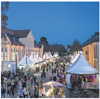
Start in vorweihnachtliches Ambiente: Den Anfang macht der Winterzauber Herrenhausen.

Der Christmas Garden kann bis zum 7. Januar 2024 zwischen 17 und 22 Uhr bestaunt werden. Ausgenommen sind die Wochenenden vom 20. und 21., 27. und 28. November sowie Heiligabend und Silvester. Tickets gibt es über die Webseite vom Christmas Garden. Sie kosten für Erwachsene 15,50, für Kinder 11 Euro.