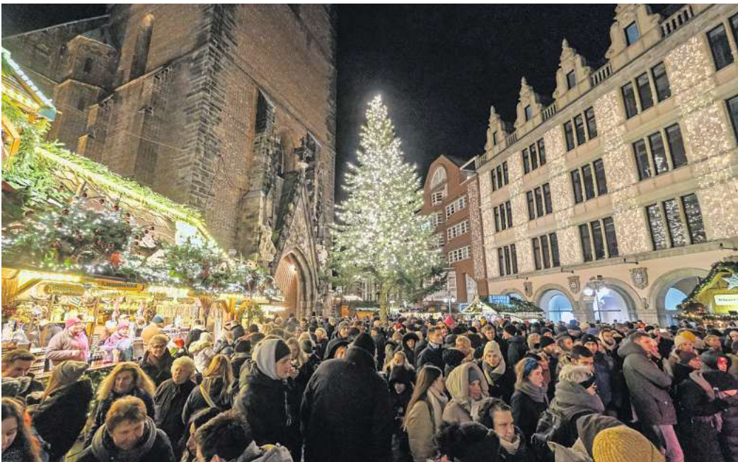
Adventliches Ambiente: Vor der Marktkirche bietet Hannovers Weihnachtsmarkt eine besondere Atmosphäre – und dazu gehört eigentlich auch die passende Musik.

Wie erklärt sich diese Kostenexplosion? In der Vergangenheit habe man die Gebühren entsprechend der von den Veranstaltern übermittelten Daten berechnet, teilt die Gema mit. „Wir haben uns auf korrekte Angaben verlassen und keine Prüfung vorgenommen“, heißt es weiter. Nach der Corona-Pandemie habe man dann genauer hingeschaut. Die Flächen wurden mithilfe digitaler Werkzeuge wie Planimeter und Programmen wie Google Maps