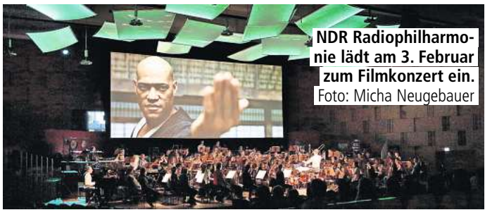
NDR Radiophilharmonie lädt am 3. Februar zum Filmkonzert ein.

Telefon KundenServiceCenter: 0800 / 0 01 92 14 (kostenfrei)