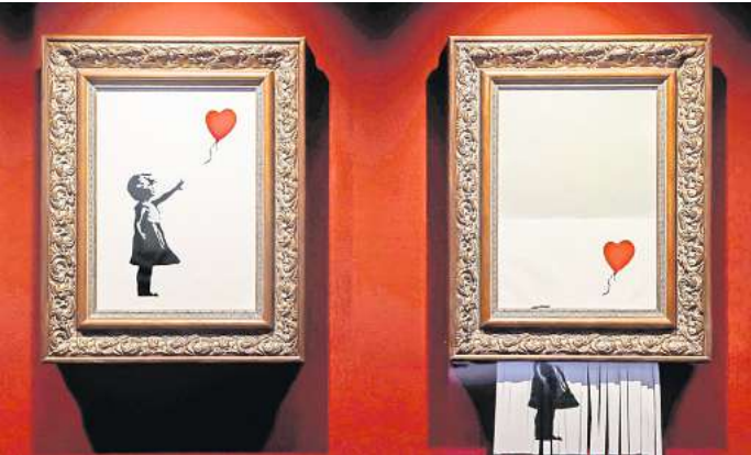
Das berühmte „Balloon-Girl“ vor und nach dem Schreddern.