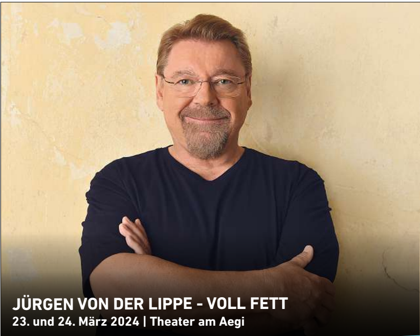
JÜRGEN VON DER LIPPE - VOLL FETT 23. und 24. März 2024 | Theater am Aegi

☛ Das vollständige Programm und Anmelde-möglichkeiten: collectingdreamsfestival.de