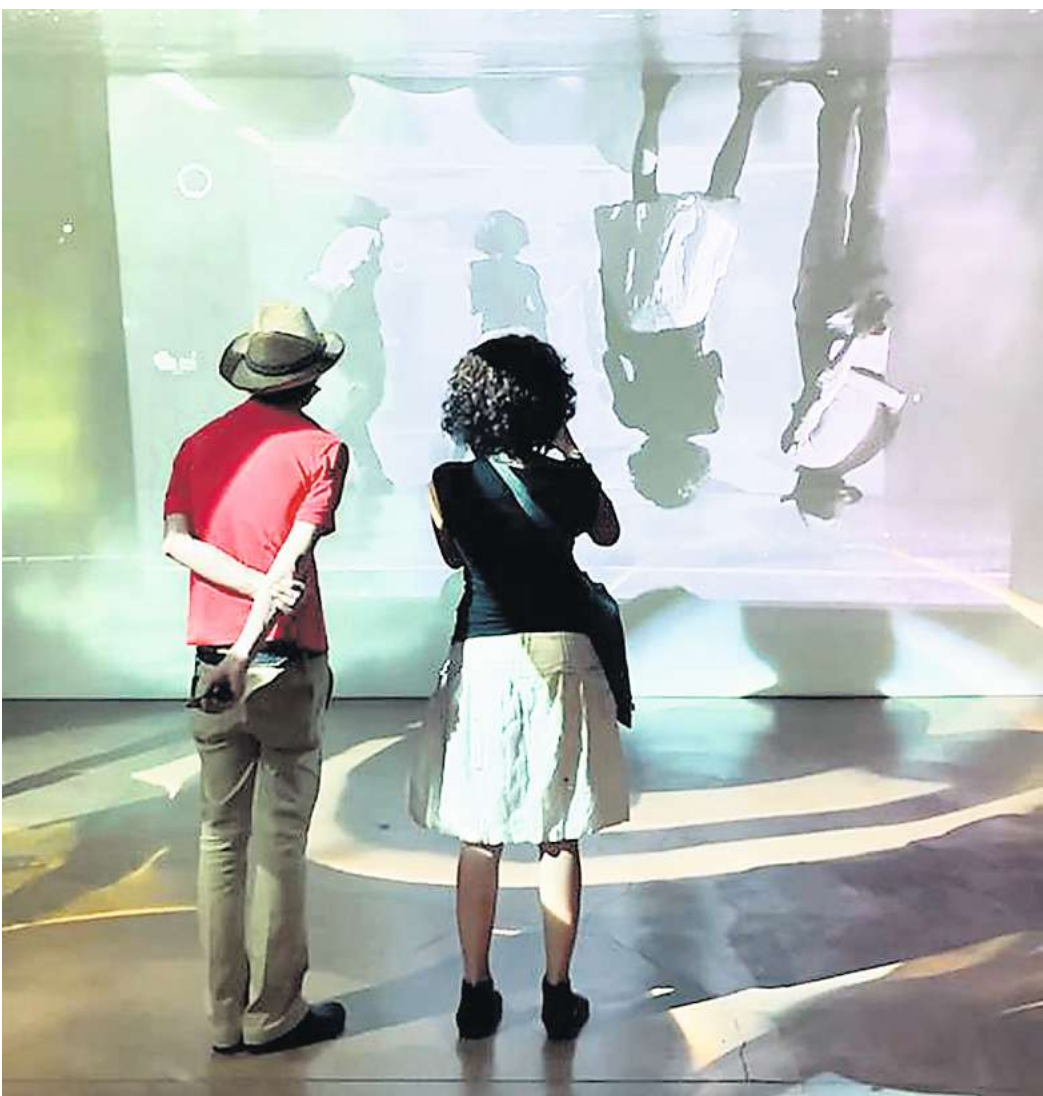
Das multimediale Projekt „Licht Zeit Labor II“ ist am und im Kesselhaus sowie in der Kunsthalle Faust zu erleben.

Colagen aus Papier entstehen im Workshop „Paperwork“ am Sonnabend ab 14 Uhr in der Kunst & Musik Etage Hannover, Vahrenwalder Straße 213. Bei LortzingART, Lortzingstraße 1, kreieren Gäste am Sonntag ab 13