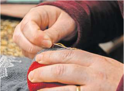
Reparieren statt wegwerfen: Das Repaircafé und eine Textilwerkstatt machen es möglich beim Impuls-Festival.