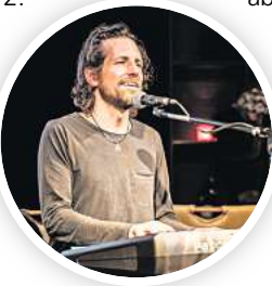
Live: Aaron English