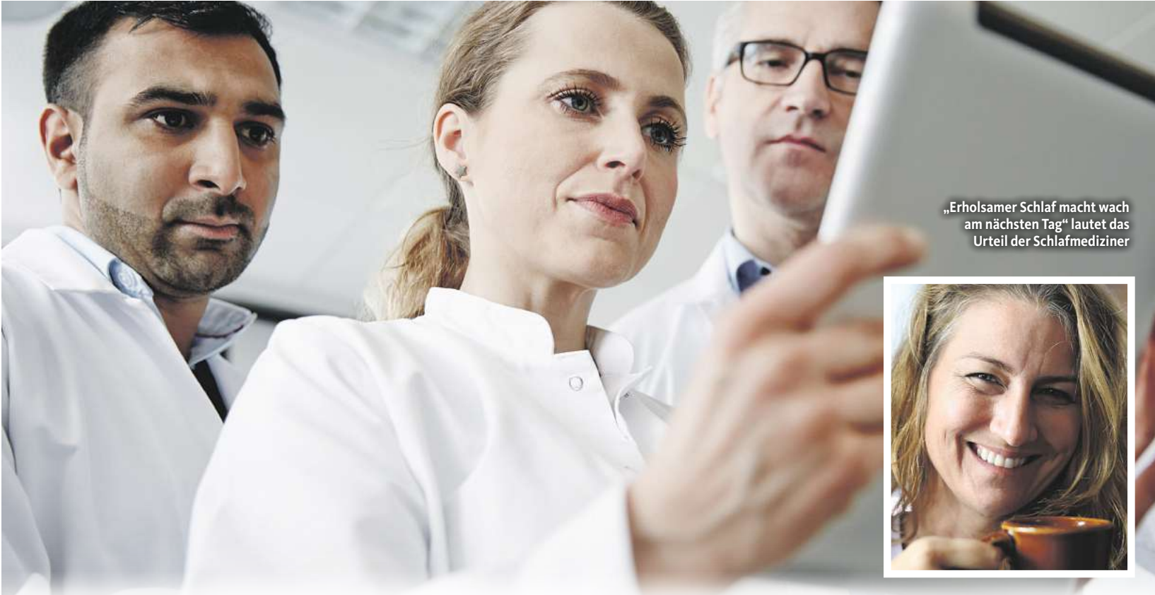
„Erholender Schlaf macht wach am nächsten Tag“ lautet das Urteil der Schlafmediziner

Die ganzheitliche Behandlung Neu in Deutschlands Apotheken ist Lioran für Nacht & Tag. Dieses Arzneimittel wurde soeben vom Bundesamt für Arzneimittel – Deutschlands höchster Gesundheits-Instanz – zugelassen. Für