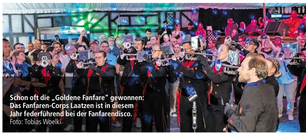
Schon oft die „Goldene Fanfare“ gewonnen: Das Fanfaren-Corps Laatzten ist in diesem Jahr federführend bei der Fanfarendisco.