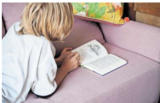
Um den Lesemuffel auf den Geschmack zu bringen, helfen ein paar kleine Tricks.

Der Ritual-Kniff: Die Lesexperten raten Eltern zudem, aus der Vorlesezeit ein festes Ritual zu machen. Das sollte ohne Druck ablaufen, immer freiwillig und spielerisch – denn Lesen soll Freude machen.