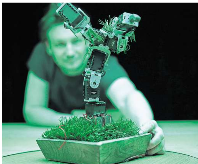
Technik zum Staunen: „Simple Machines“ erzählt die Geschichte eines Künstlers, der sich selbst abschafft.