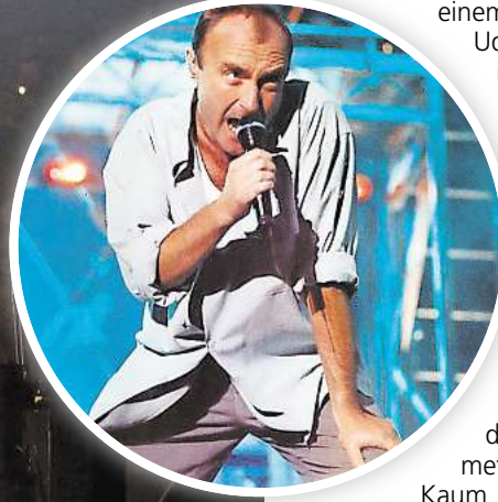
Auf dem Zenit: Phil Collins 1994 bei einem seiner Konzerte im Niedersachsenstadion.

HANNOVER. Viermal Apache 207. Am 18., 19., 21. und 22. Januar in der vollen ZAG Arena, der größten Halle der Stadt. Apache 207, Rapper aus Mannheim, bürgerlich Volkan Yaman, Abitur 2017, künstlerischer Durchbruch 2019, jetzt knapp 50.000 Fans – seit einem Duett mit Udo Lindenberg in allen Altersklassen –, die sich seine Konzerte allein in Hannover ansehen. Gut sechs Jahre abzüglich Pandemie. Ein Kometenanstieg. Kaum Shootingstar, schon Superstar?