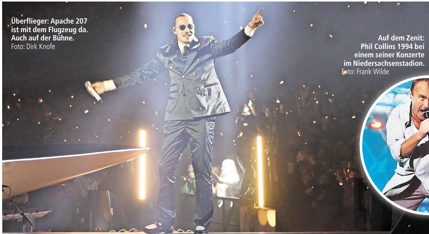
Überflieger: Apache 207 ist mit dem Flugzeug da. Auch auf der Bühne.

REKORDKULISSEN AUF DEN KONZERTBÜHNEN: Vierfacher Apache, fünffache Helene – und ganz viel Collins