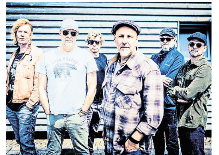
Immer für volle Hallen gut: Fury In The Slaughterhouse.