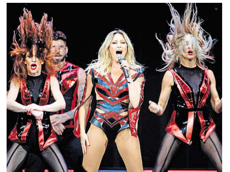
Im Rausch: Helene Fischer 2023 auf der Bühne der ZAG Arena.