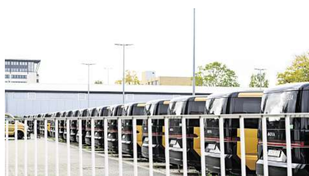
Moias parken noch in Hannover am Wasserturm.

nomes Fahren – und testet es unter anderem in Hamburg, wo nicht sogenannte Sicherheitsfahrer an Bord sind. Die Firma mit Hauptsitz in Hamburg betreibt nicht mehr das klassische Ridepooling, also ein Mobilitätsangebot ohne Fahrplan und feste Haltestellen. Nutzerinnen und Nutzer können die gold-schwarzen Elektro-Crafter nicht mehr im Stadtgebiet. Mehr als 50 von ihnen parken noch auf dem Firmengelände am Wasserturm. Diese Fahrzeuge zumindest passen nicht in die neue strategische Ausrichtung des Unternehmens, wie ein Sprecher auf Anfrage mitteilt. Deshalb schließt er auch aus, dass sie jemals wieder in Hannover unterwegs sein werden. Moia setzt mittlerweile auf auto-