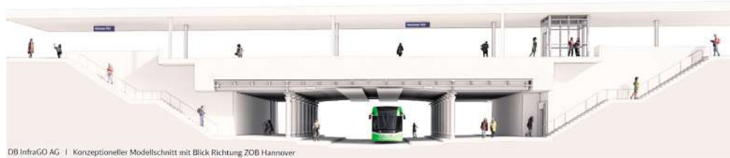
DB InfraGO AG | Konzeptioneller Modellchnitt mit Blick Richtung ZOB Hannover

die vorher schon feststanden. Subtext: Die Aufregung wäre nicht nötig gewesen.