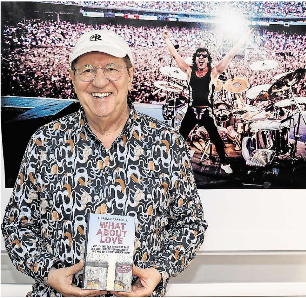
Schlagzeuger und Autor – Herman Rarebell mit neuem Buch.

Mehr Auszeichnungen hat „Wind of change bekommen“ und der war ja auch in 20 Ländern Nummer Eins. Aber mein Song „Rock You Like A Hurricane“ wird bis heute mehr gespielt