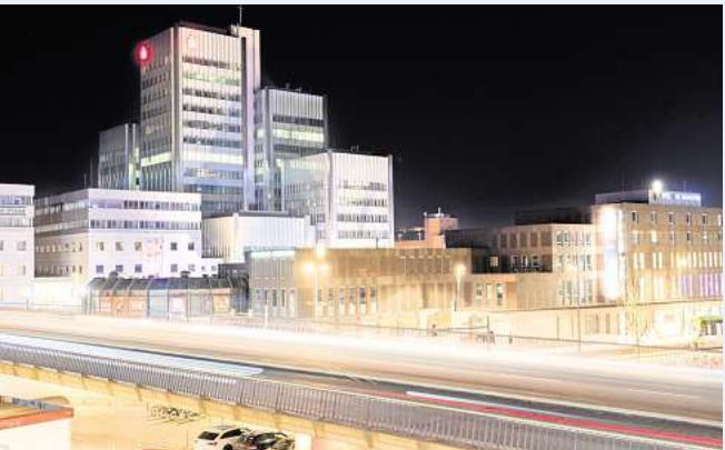
Stehen vor großen Veränderungen: Der Raschplatz und sein Umfeld.