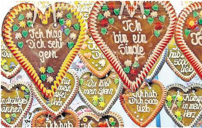
Bald wieder da: Lebkuchenherzen mit flotten Sprüchen.