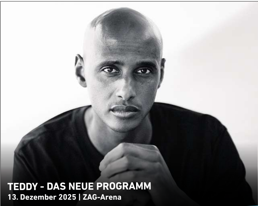
TEDDY - DAS NEUE PROGRAMM 13. Dezember 2025 | ZAG-Arena

Reservierungen sind möglich unter stadtteilkultur-vahrenwald@hannover-stadt.de