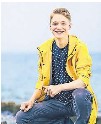
Echtes Nordlicht: Till Frömmel.