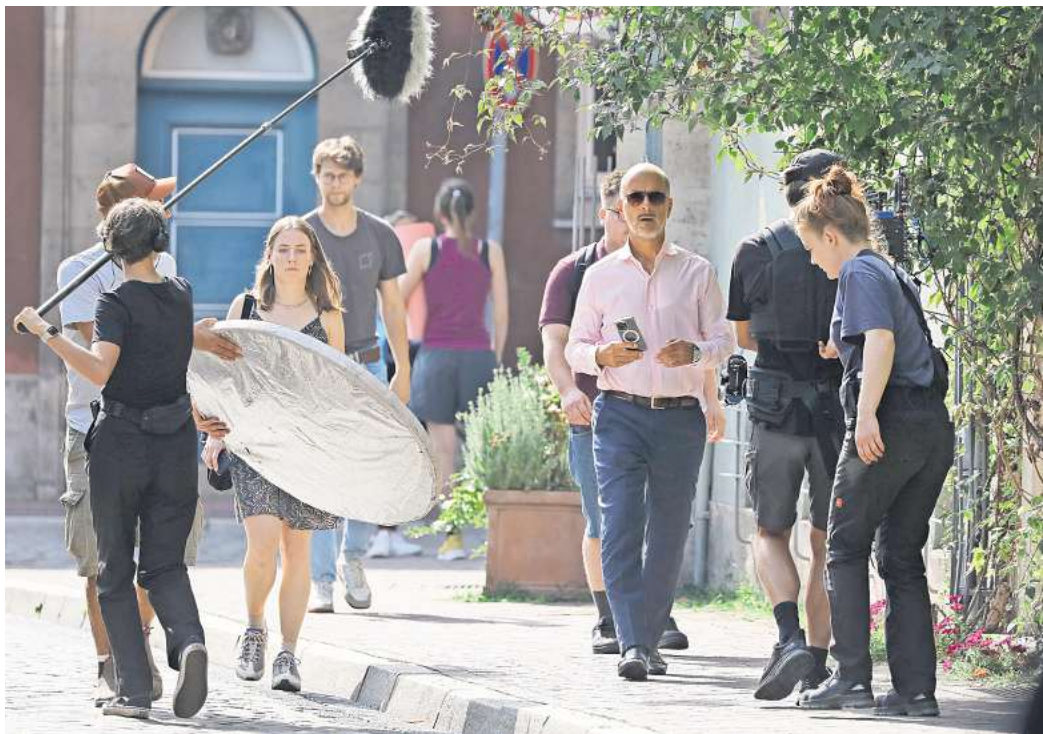
Christoph Maria Herbst dreht am Ballhofplatz.