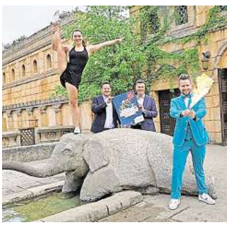
Akrobatik, Comedy und Zauberkunst: Der Zoo Hannover lädt ein zu magischen Nächten.