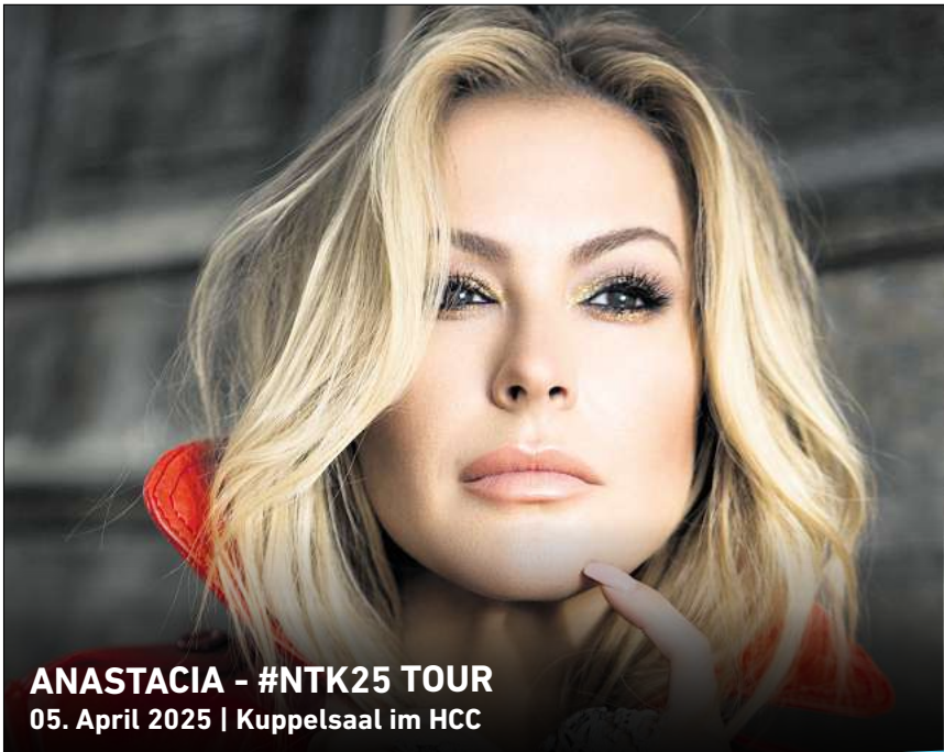
ANASTACIA - #NTK25 TOUR 05. April 2025 | Kuppelsaal im HCC

HANNOVER. Noch bis zum 8. August stellt das Italienische Generalkonsulat, Freundallee 27, unter dem Titel „Neue italienische Emigration“ Fotografien zu Geschichten und Standpunkte von Italienern und Italienerinnen aus dem 21. Jahrhundert aus. Der strukturelle Charakter des italienischen Migrationsphänomens und der Alterungstrend der einheimischen italienischen Bevölkerung bilden den Ausgangspunkt des Fotografie-Projekts, das neue italienische Einwanderer in Deutschland portraitiert. Geöffnet ist die Ausstellung jeweils Dienstag bis Freitag von 9 bis 12 Uhr und Montag und Mittwoch von 15 bis 17 Uhr. Der Eintritt ist frei. RED