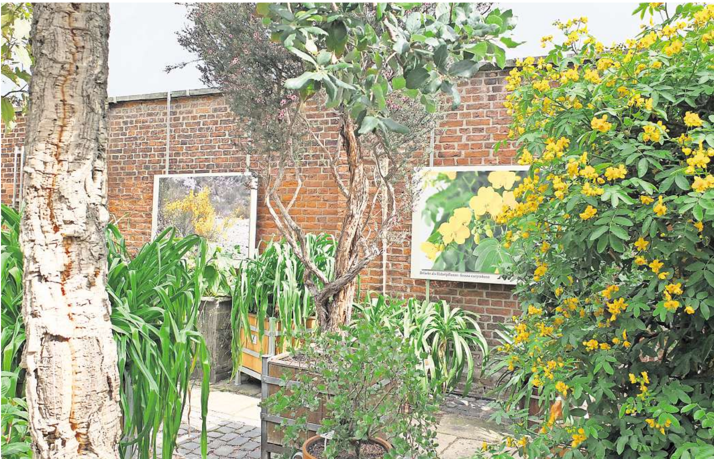
Färbende und giftige Schönheiten: Die Ausstellung im Subtropenhof zeigt nicht nur faszinierende Pflanzen, sondern erklärt auf 15 Schautafeln auch deren Besonderheiten.