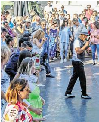
Beim Schnupper-Tanzkursus auf dem Ballhofplatz gibt es Salsa zum Mitmachen.

vom Quartiersverein Forum hannöversche Altstadt e.V. veranstaltet wird, die Besucher mit einem sommerlichen kulinarischen Angebot verwöhnen. Als weiterer Mitorganisator zeichnet sich die Tanzschule Salsa del Alma verantwortlich. RED Der Eintritt ist frei.