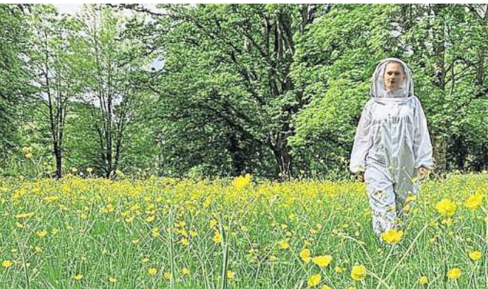
Open-Air-Theater: „Viecher“. Foto: Theaterkollektiv MÜH

Der Eintritt ist frei, kostenlose Tickets können online reserviert werden unter pretix.eu/MUEH/viecheropenair