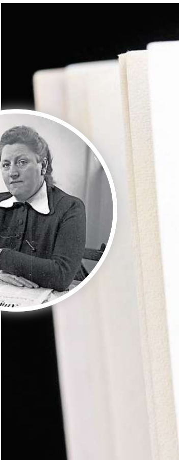
Das Grundgesetz der Bundesrepublik feiert in diesem Jahr seinen 75. Geburtstag. Es wurde am 23. Mai 1949 erlassen.

Wünschenswert wäre eine entsprechende Korrektur im Stil der politischen Debatten: Deutsch-