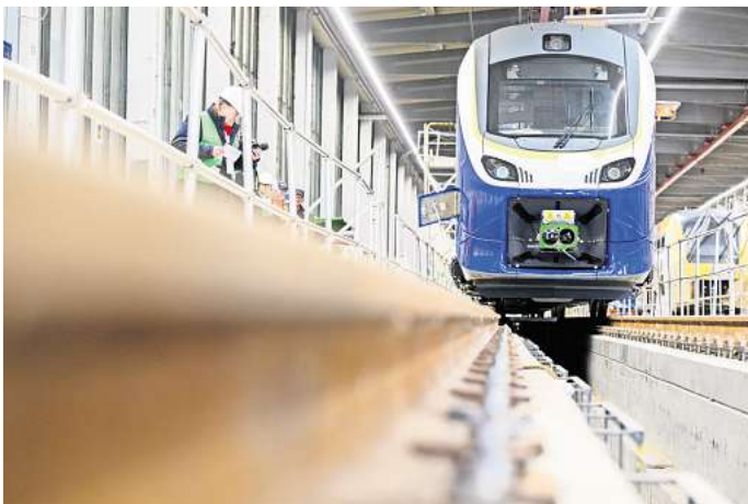
Mit den Zügen vom Typ Coradia Max werden ab 2025 Bremen, Hannover, Oldenburg, Wilhelmshaven, Norddeich-Mole sowie Osnabrück und Bremerhaven miteinander verbunden.

Inneren die Anforderungen an die Barrierefreiheit erfüllen. Andere erhalten nach Aussage des LNVG-Bereichsleiters einen Mehrgenerationenbereich, in dem Eltern einen Kinderwagen oder Senioren ihren Rollator abstellen können. Wie im Metronom lässt sich auch bei den künftigen Zügen, für deren Betrieb