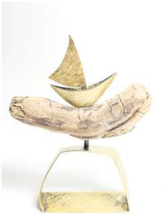
Objekt „Unterwegs“ von Meike Kröger.

70er-Jahre und setzt diese zeitgemäß um in einer Kollektion aus naturbelassenen Leinen, die sie im Siebdruckverfahren mit Blumenmotiven zierte. Daraus entstehen dann Mäntel und Hosenskleider. Während wird das