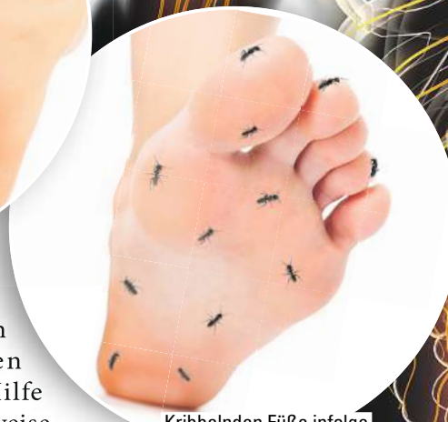
Kribbelnden Füße infolge von Nervenschmerzen?

der einzelne darin enthaltene Wirkstoff kann bei nervenbedingten Schmerzen wertvolle Hilfe leisten. So setzt beispielsweise Gelsemium sempervirens laut Arzneimittelbild im zentralen Nervensystem an, also unter anderem im Rückenmark. Der Arzneistoff Iris versicolor kommt hingegen bei ausstrahlenden Schmerzen wie einer Ischialgie und ziehenden, brennenden Schmerzen im Hüftnerv zum Einsatz.