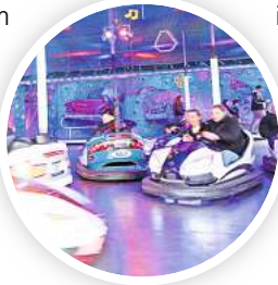
Es geht wieder rund auf dem Frühlingsfest.