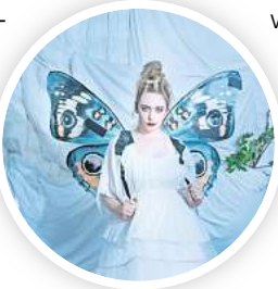
Das Schauspiel Hannover zeigt das Familienstück „Hex. Dornröschen im Feenwald“.

Weitere Termine und Vorverkauf: staatstheater-hannover.de