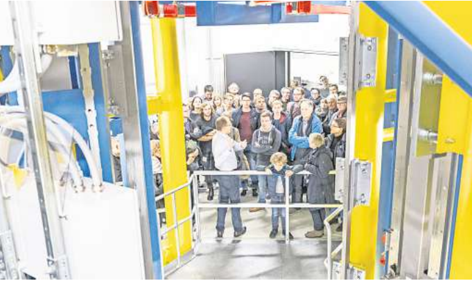
Zu besichtigen: Der Einstein-Elevator ermöglicht Experimente in der Schwerelosigkeit.

Vollständiges Programm: ndw.uni-hannover.de