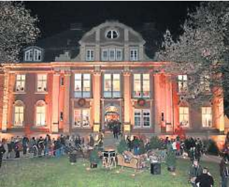
Winterträume: stimmungsvolles Stöbern auf Schloss Eldingen.

Das GROSSE FESTIVAL zum Schauen, Genießen und Kaufen