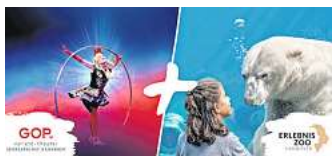
Das neue Kombiticket von Zoo und GOP bietet einen „Tag voller Erlebnisse“.

❖ Tickets und Termine unter www.variete.de/hannover