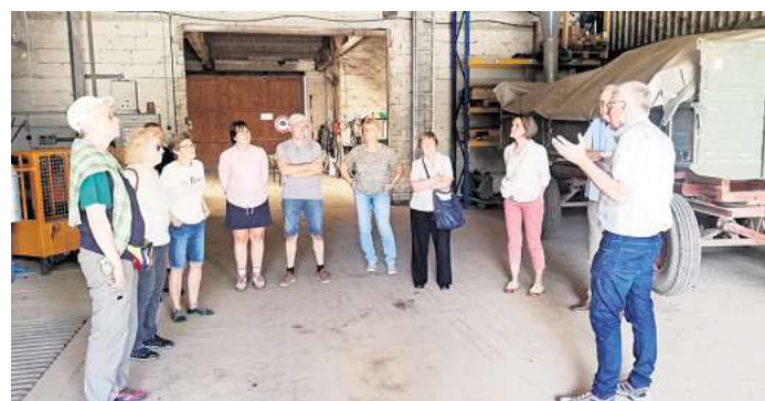
Die „Bestager“ lassen sich den Hof bei einer Tour zeigen.