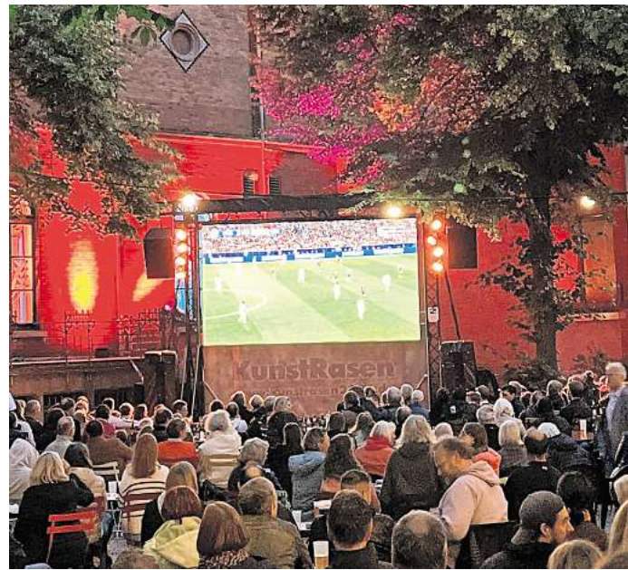
Zur Fußball-EM 2024 feierte der KunstRasen seine Premiere.