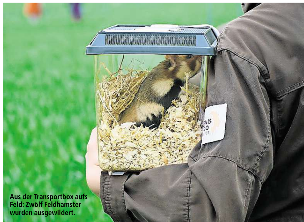
Aus der Transportbox aufs Feld: Zwölf Feldhamster wurden ausgewildert.