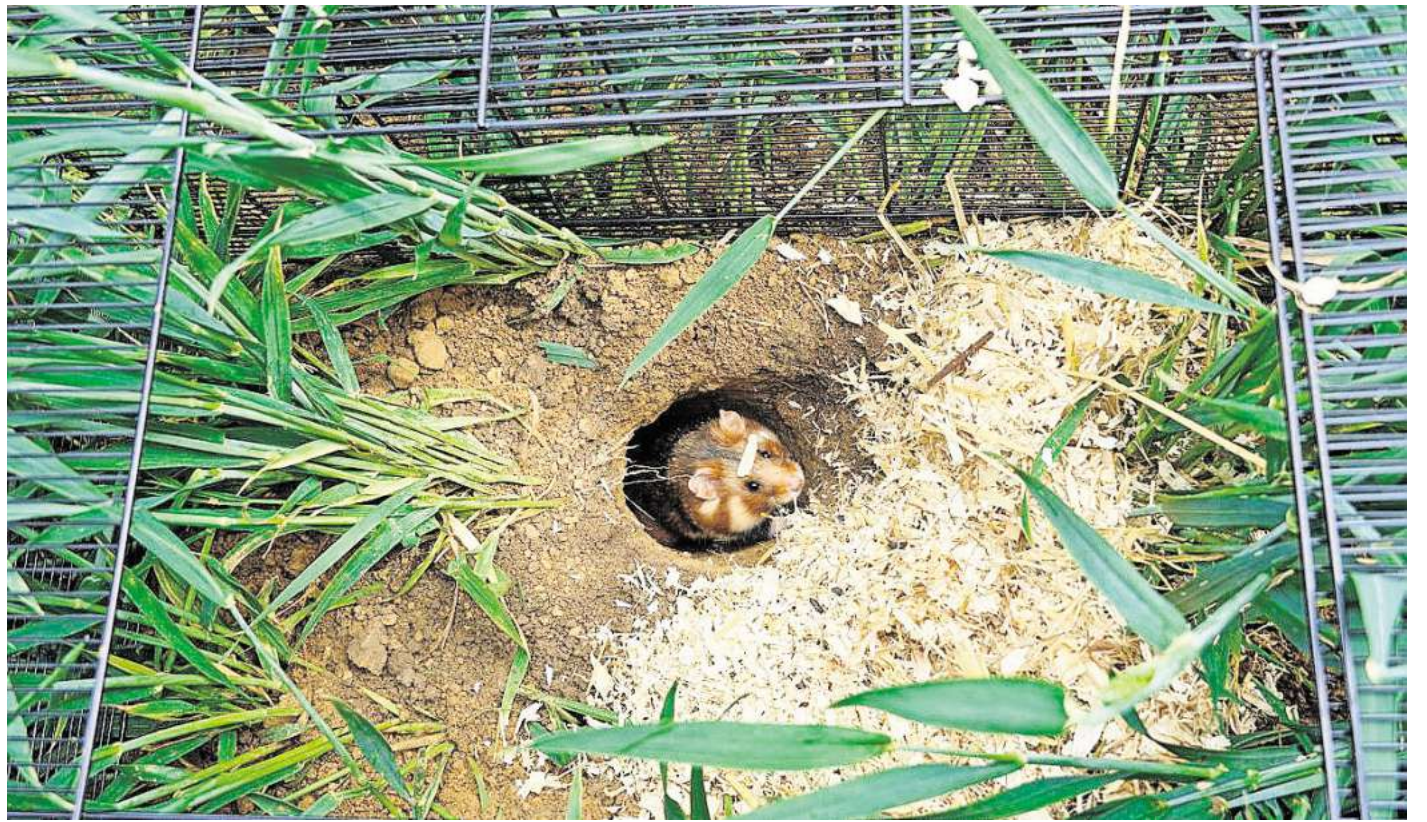
In vorgebohrten Bauten konnten die Feldhamster gleich unter der Erde verschwinden.

Der Erlebnis-Zoo Hannover sieht in dem Projekt einen wichtigen Beitrag zum Schutz heimischer Arten. „Mit der Zucht der