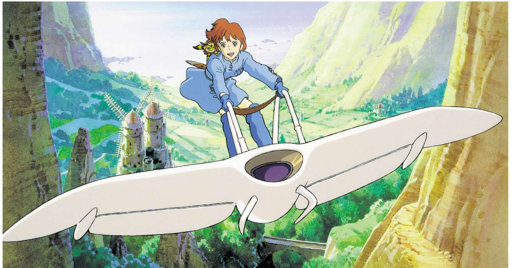
Das Cinema del Sol zeigt den Anime-Klassiker „Nausicaä - Aus dem Tal der Winde“.

Filmstil: 1984 Hayao Miyazaki/Studio Ghibli