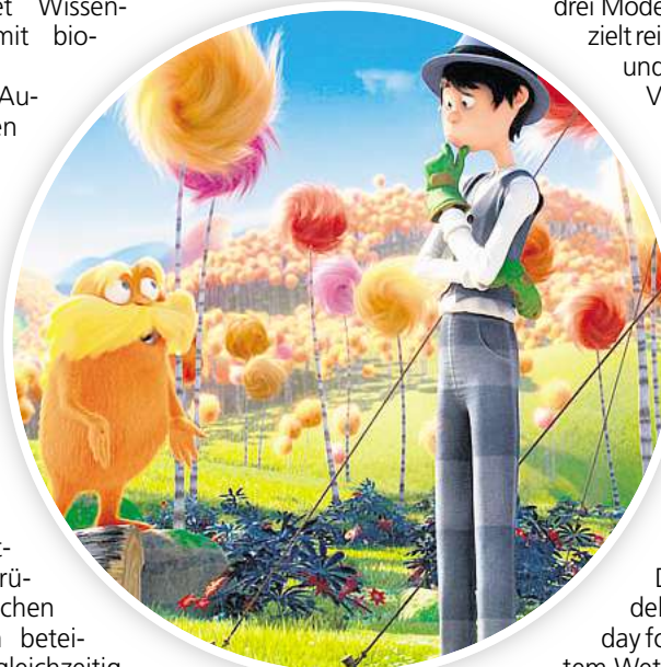
Im Park der Sinne in Laatzen gastiert das Cinema del Sol mit dem Film „Der Lorax“.

Im August und September organisiert das Cinema del Sol im Stadtpark Hannover eine Reihe mit Filmklassikern der 1950er Jahre. Am Donnerstag, 20. August, läuft „Natürlich die Autofahrer“. Die deutsche Komödie