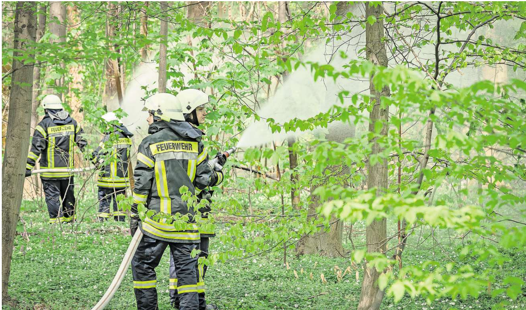
Löschangriff im dichten Grün: Einsatzkräfte der Stadtfeuerwehren aus Pattensen und Laatzen bekämpfen den fiktiven Waldbrand im Ricklinger Holz mit reichlich Wasser.

Neue Website: Feingold 125,50 €/g 750 Gold 93,00 €/g 585 Gold 72,54 €/g 333 Gold 41,29 €/g Zahngold 78,25 €/g Silber 1,76 €/g Versilbert 40,00 €/kg Zinn 16,00 €/kg Goldankauf Bott Bahnhofstr. 12 • 30159 Hannover ☎ 0511/37359069