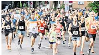
Start zum 10-Kilometer-Lauf

Auch der Nachwuchs ist eingebunden: Beim Bambini-Lauf legen Kinder eine Strecke von 1,2 Kilometern zurück. Der Start erfolgt um 17.15 Uhr. Es folgen der 3,5-Kilometer-Lauf um 17.30 Uhr, der 6,5-Kilometer-Lauf um 18 Uhr sowie der Hauptlauf über 10 Kilometer um 19 Uhr. Die Walker starten um 19.05 Uhr. Parallel zum Geschehen im Start- und Zielbereich findet das Laatzener Winzerfest statt, das vom Freitag, 19. Juni, bis Sonntag, 21. Juni, veranstaltet wird. Damit besteht für Teilnehmende und Besucher die Möglichkeit, den Veranstaltungstag in geselliger Atmosphäre ausklingen zu lassen. RED