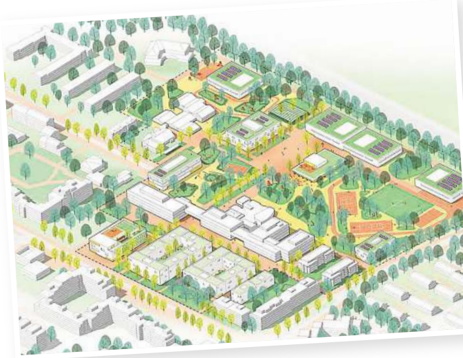
Die Visualisierung zeigt den geplanten Campusplatz. Grafik: Cityförster

Mit der Vorstellung des Masterplans ist ein wichtiger Meilenstein erreicht – abgeschlossen ist das Projekt damit aber nicht. Die konkrete Umsetzung hängt von politischen Entscheidungen, finanziellen Rahmenbedingungen und weiteren Planungen ab. Klar ist jedoch: Der Bildungscampus soll mehr sein als eine Ansammlung von Schulgebäuden. Er ist als Ort gedacht, der Bildung, Begegnung und Stadtentwicklung miteinander verbindet – und damit ein Stück Zukunft für Laatzen gestaltet. RED