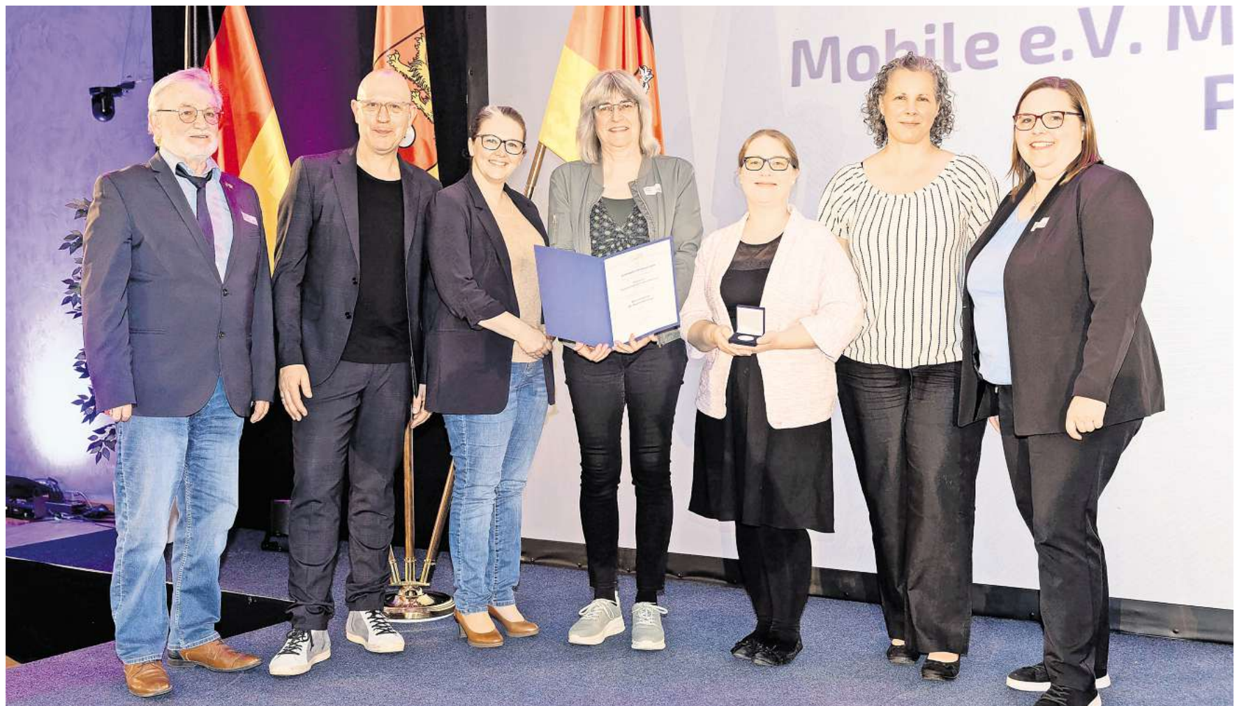
Der Verein MOBILE aus Pattensen wurde mit der Ehrenmedaille der Region Hannover ausgezeichnet.

Ein zentrales Beispiel für gelebte Nachbarschaft in Pattensen ist das MOBILE e. V. Mehrgenerationenhaus. Seit Jahren schafft die Einrichtung verlässliche Strukturen für Unterstützung und Begegnung im Alltag. Rund 100 ehrenamtliche Helferinnen und Helfer engagieren sich hier in ganz unterschiedlichen Bereichen – von Besuchsdiensten über einen kostenlosen Mittagstisch bis hin zu Angeboten für Menschen mit Demenz oder in Trauersituationen. Im Mittelpunkt steht dabei