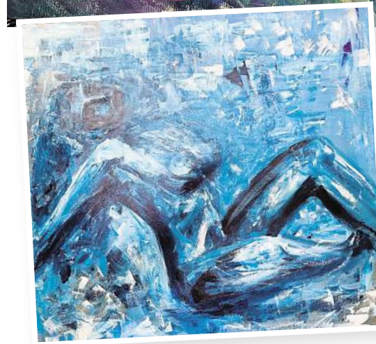
LaBruja: "Nude", 2025. Acryl auf Leinwand

LAATZEN. In der GlowArt Gallery im Leine Center in Laatzen ist derzeit die Ausstellung „Das Auge des Betrachters – The Eye of the Beholder“ der Künstlerin LaBruja alias Bettina Dresemann zu sehen.