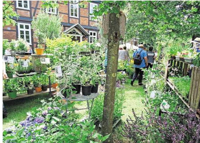
Das Gartenfestival Blumen & Ambiente findet in diesem Jahr vom 30. April bis zum 3. Mai statt.