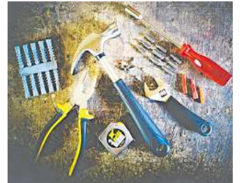
Gemeinsam reparieren.

Das offene Café wird regelmäßig veranstaltet und findet jeweils am ersten und dritten Freitag im Monat von 15 bis 17 Uhr statt.