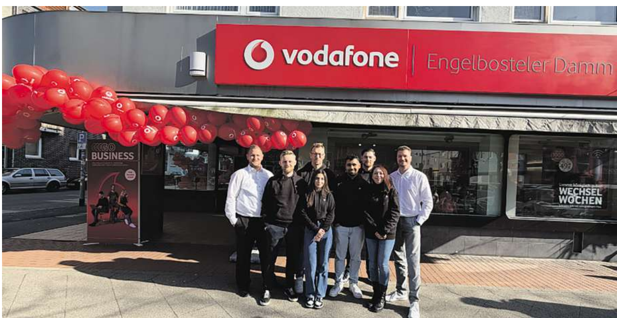
Das neue Team am Engelbosteler Damm freut sich auf neue und bekannte Gesichter.

Ob Privatkunde oder Geschäftskunde – in den modernen Räumen neh-