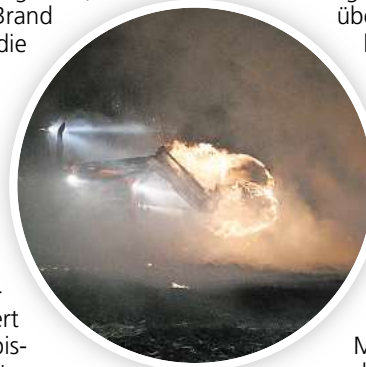
Transport der brennenden Strohballen auf ein angrenzendes Feld.

Straße unterwegs war, hatte den Brand entdeckt und die Feuerwehr alarmiert. Nach bisherigen Angaben waren etwa zwölf Rundballen, die am Rand eines Waldwegs gelagert hatten, aus bislang ungeklärter Ursache in Brand geraten. Die Brandstelle lag am Ende einer