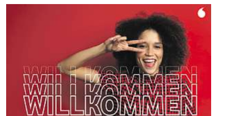
Vodafone in Hannover – neu gedacht, persönlich gemacht.

Das neue Team am Engelbosteler Damm freut sich auf gute Gespräche, neue Gesichter, bekannte Stammkunden und auf alle, die Wert auf ehrliche Beratung legen.