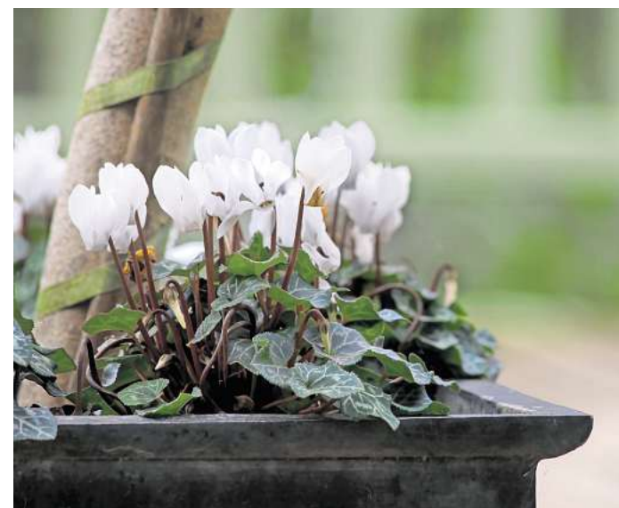
Rosa oder weiß: Wer kein leuchtendes Pink im Garten mag, sollte die Alpenveilchen-Sorte „Album“ wählen.