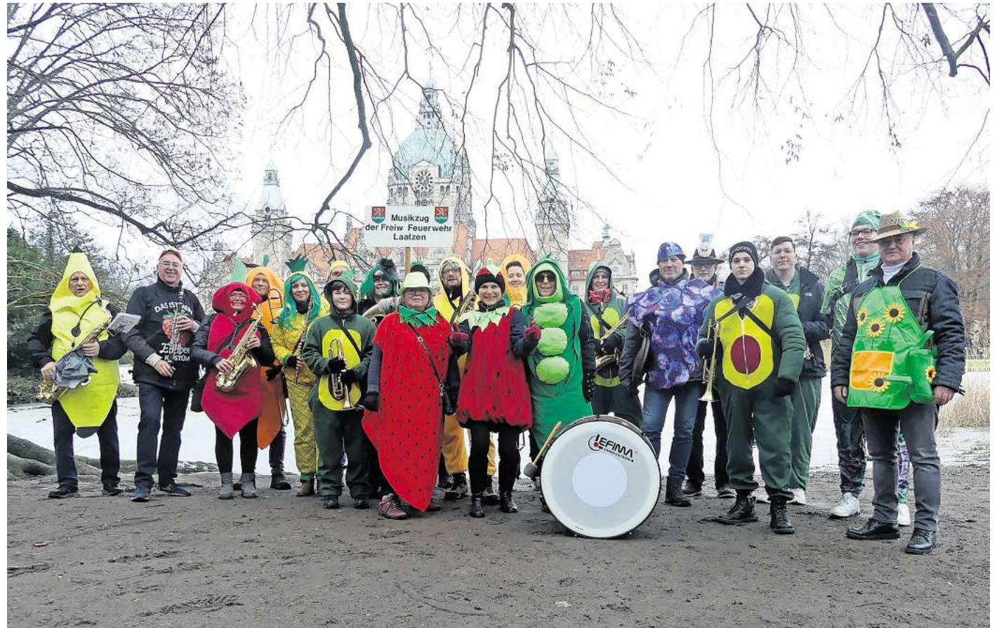
Vitaminreich verkleidet: Der Feuerwehrmusikzug Laatzen nahm am Umzug der Karnevalisten in Hannover teil – in bunten Obst- und Gemüse-Kostümen.

Mitglieder des FEUERWEHRMUSIKZUGES der Stadt Laatzen nahmen am großen Karnevalsumzug in Hannover teil und begeisterten mit ihren Kostümierungen