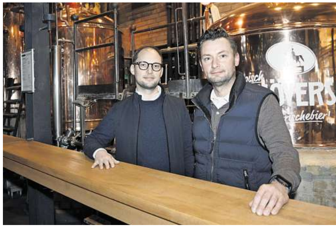
„Bei uns können drei Generationen an einem Tisch feiern.“

magaScene: Ihr habt 2010 die Geschäftsführung von Eurem Vater übernommen. Was hat Euch am Thema Gastronomie gereizt?