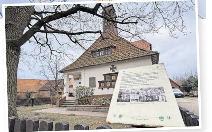
Vorbild Ingeln: Im östlichen Teil des Doppeldorfes hängen bereits seit rund 20 Jahren Infotafeln an besonderen Gebäuden wie hier der 1911 erreichten und bis 1973 betriebenen alten Schule. Die Heimatfreunde Ingeln haben die Erklärtafeln 2024 erneuert.

Pflugplatz, einer früheren Schmiede sowie vor der bis 1973 betriebenen alten Ingelner Schule.