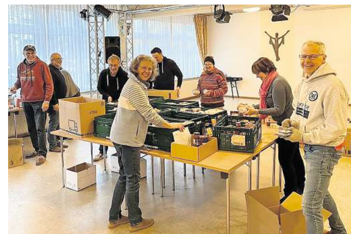
Sortieren die gespendeten Lebensmittel in Kisten um: Helferinnen und Helfer der St.-Oliver-Kirchengemeinde.