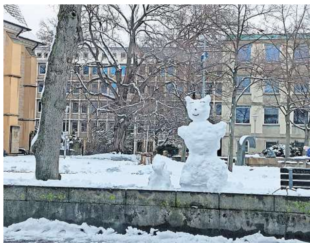
Schnee in Hannovers Calenberger Neustadt.