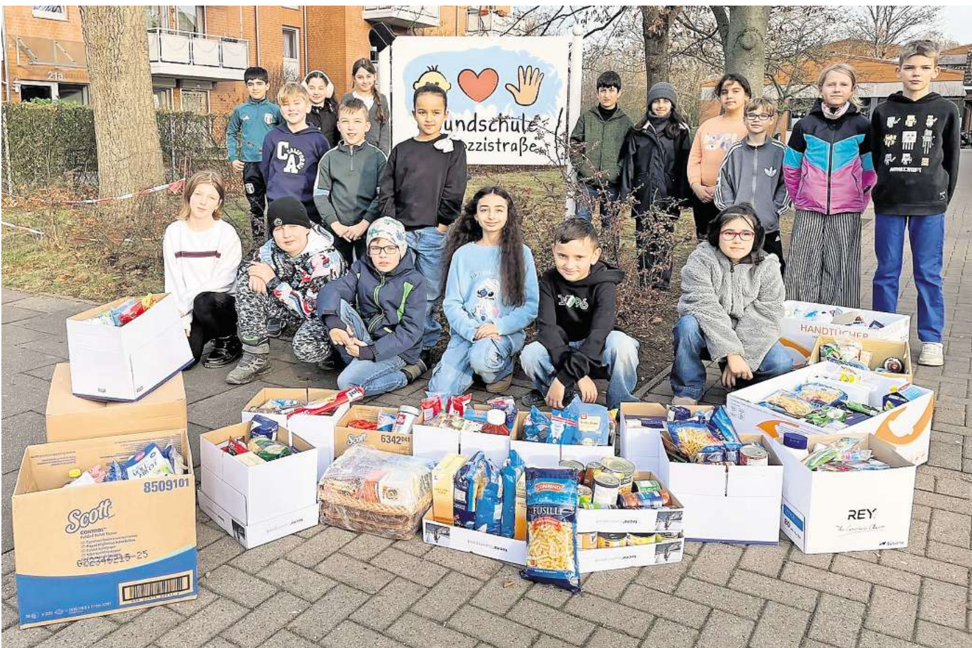
Haben etliche Kisten beigesteuert: Schülerinnen und Schüler der Grundschule Pestalozzistraße.