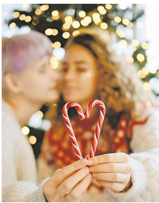
Wahlfamilie: Zum Fest der Liebe dürfen neue Familientraditionen etabliert werden.

Feiern mit der Wahlfamilie bedeutet oft, Traditionen zu ersetzen oder neue zu erfinden. Es bedeutet, einen Tisch zu decken, an dem Menschen sitzen, weil sie sich füreinander entschieden haben. Und vielleicht ist genau das die schönste Art, Weihnachten zu feiern: mit einem Kreis, der nicht durch Zufall oder aus-