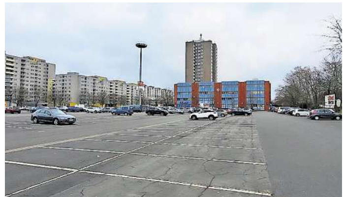
Bietet üblicherweise viel Platz für Autos: Der Parkplatz 2 am Leine-Center in Laatzten liegt in unmittelbarer Nähe zu den Stadtbahnhaltestellen Laatzten-Zentrum und Park der Sinne.

Zudem werde die Verwaltung bei Händlern im Stadtgebiet dafür werben, sich am bundesweiten Refill-Programm zu beteiligen, so Brinkmann weiter. Derzeit bietet nur der Nabu Laatzten (Ohestraße) eine Zapfstation für Trinkwasser an. Künftig sollten runde blaue Aufkleber bei Geschäften oder anderen öffentlichen Orten in Laatzten anzeigen, wo es kostenlos Leitungswasser gibt. Auch im Rathausfoyer werde eine Station eingerichtet, so Brinkmann – selbst wenn diese nur einen Sommer zu nutzen sei, weil das Rathaus ab 2027 abgerissen wird.