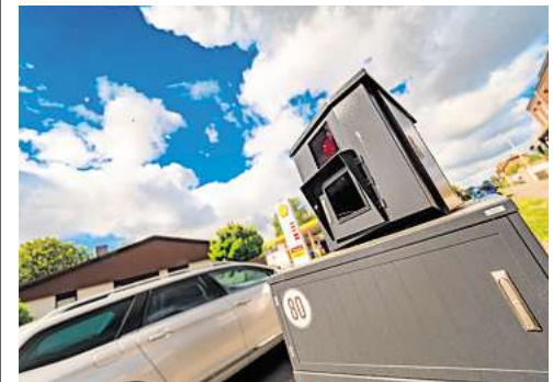
Blitzeranhänger