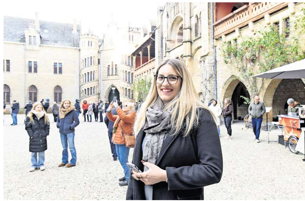
Erlebnis Marienburg: Am Wochenende haben Tausende Fans der Serie „Maxton Hall“ das Schloss besuchen können – und wie Janine Koch jede Menge Fotos gemacht. Aber auch andere Interessierte waren begeistert.

Es ist nicht nur die Serie, die Besucherinnen und Besucher auf die Marienburg lockt. „Wir sind geschichtlich sehr interessiert“,