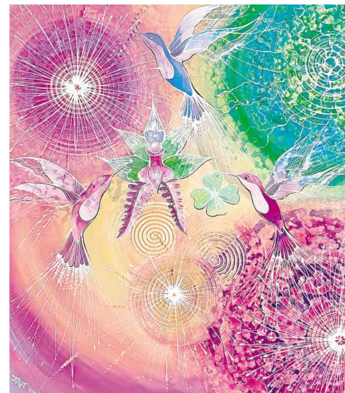
„Mein Paradies“ heißt dieses Werk der Künstlerin DARA. Courtesy of the artist

wohl an Einsteigerinnen und Einsteiger als auch an erfahrene Kunstschaffende. Die begrenzte