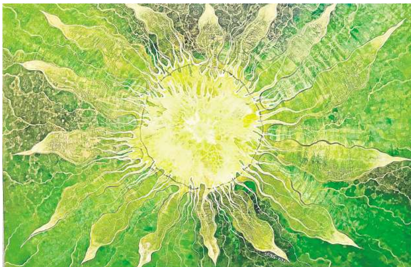
„Herzfrequenzen“ nennt die Künstlerin diese Arbeit. Die Vernissage mit ihren Bildern beginnt am Sonntag, 15. November, um 15 Uhr.

Teilnehmerzahl sorgt dabei für eine persönliche Atmosphäre und individuelle Betreuung.