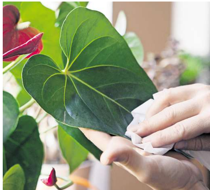
Einmal wischen, bitte: Eine Staubschicht auf den Blättern kann die Energiegewinnung einer Pflanze einschränken.

Um Blattverlust durch Lichtmangel vorzubeugen, lässt sich laut IVA aber auch mit einem LED-Zusatzlicht nachhelfen. Ausnahmen sind Pflanzen, die Dunkelheit gut vertragen, wie etwa die Schusterpalme, die Grönlilie oder die Efeutute. Sie fühlen sich demnach auch im Winter in einiger Entfernung vom Fenster noch wohl.