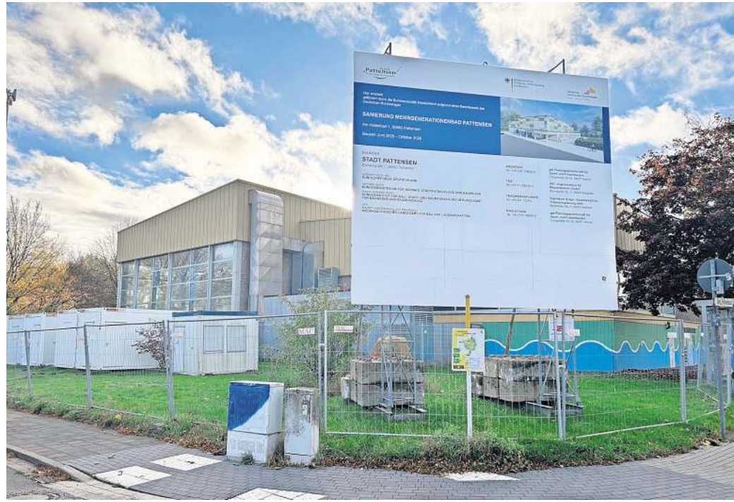
Großbaustelle: Das Pattenser Bad wird umfassend saniert.

Zu den Überraschungen während des Abrisses zählt unter anderem die Problematik beim Entfernen der Wandfliesen. Diese Arbeit gestaltet sich deutlich schwieriger als gedacht. „Die Mauer leidet, wenn man die Fliesen abschlägt“, sagt Bad-