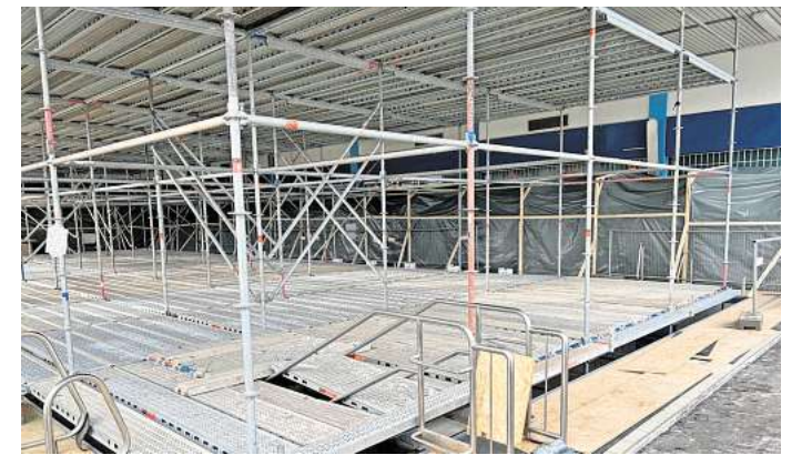
Kaum wiederzuerkennen: Die Empore im Hallenbadbereich ist schon verschwunden. Im Becken steht ein großes Gerüst.

im Bad. „Wir freuen uns, mit der Stadt so gut im Austausch zu sein. Jeden Tag ist jemand von uns hier“, betont er. „Wir gucken, ob abends alles richtig abgeschlossen ist. So sparen wir uns den Sicherheitsdienst.“