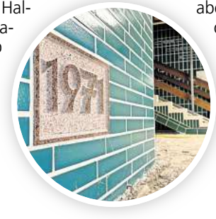
Die Kachel zeigt es an: Die Fliesen stammen aus dem Jahr 1971.

Im Schwimmbecken steht inzwischen ein großes Gerüst, das bis unter die Hallendecke reicht. Dafür wurde vorab die Empore, auf der in der Vergangenheit beispielsweise Kindergeburtstage gefeiert werden konnten, zurückgebaut. „Die Decke kommt komplett raus“, sagt Oeltermann. Die Lichtstrahler sollen künftig nicht mehr unter der Decke angebracht werden. „Da kommt man im Zweifel ganz schwer oder eigentlich gar nicht mehr heran“, sagt Oeltermann. Das Licht soll an die Säulen montiert werden.