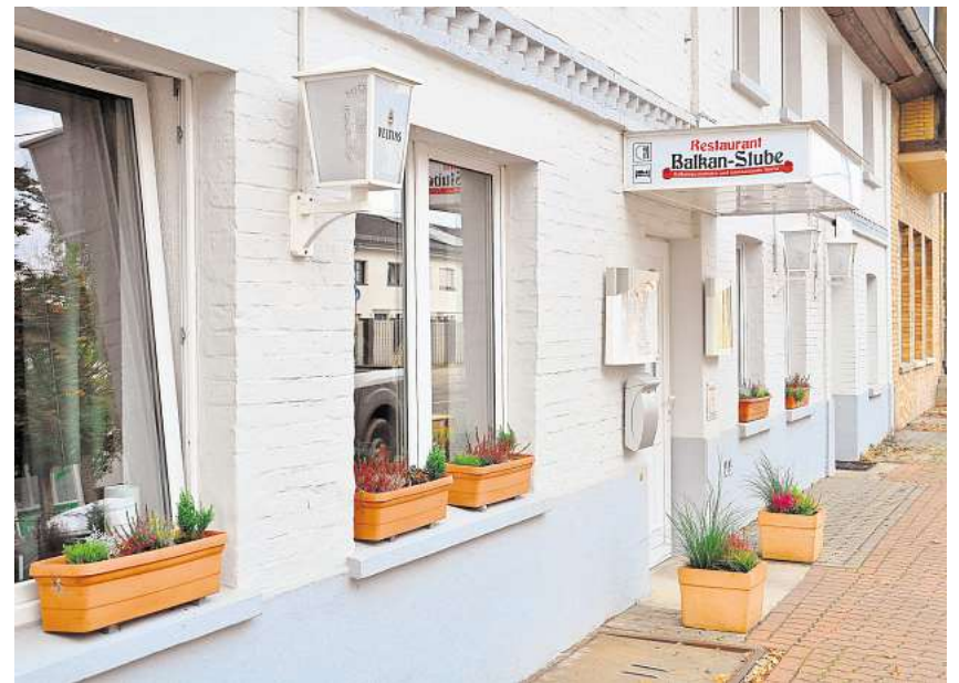
Beliebt für ihre Spezialitäten: die Gleidinger Balkan-Stube, in der Hildesheimer Straße 512.

Die Speisen können auch gern telefonisch unter Telefon (05102) 93 10 994 bestellt und dann abgeholt werden. Alternativ dazu bietet