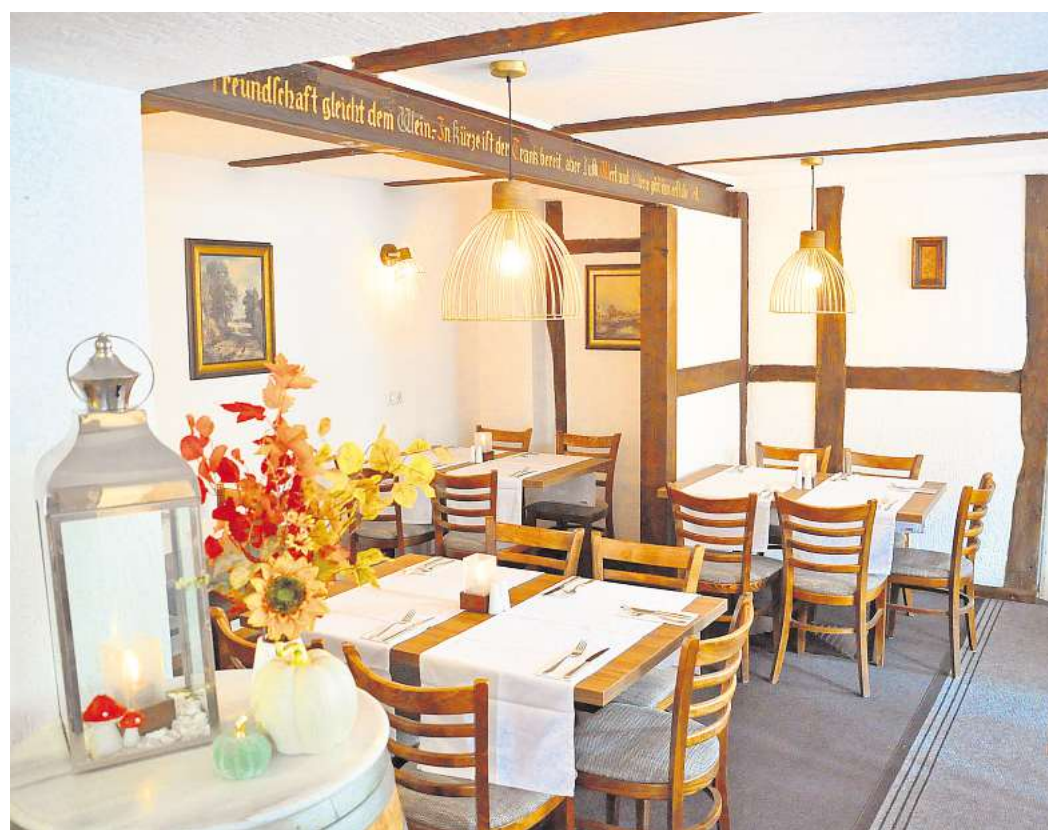
Ob als Paar, mit Familie oder aber für eine Feier: die Gleidinger Balkan-Stube lädt zu genussvollen Stunden ein.